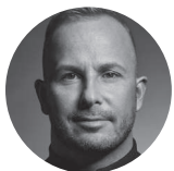
YANNICK NÉZET-SÉGUIN Chef — Conductor