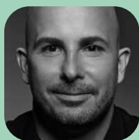
Yannick Nézet-Séguin Chef et piano